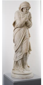
* Travaux Pierre, la Frileuse , 1867, H. 170 cm ; l. 63,5 cm ; P.65,5 cm

*Possibilité d'attirer l'attention des élèves sur la Frileuse de Travaux Pierre réalisée en 1867, pour la comparer à L'Hiver de Houdon dite aussi « la Frileuse » dont un moulage se trouve dans l'atrium.