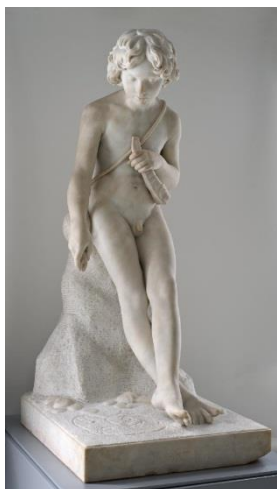
Le Gendre-Héral Jules-François, Giotto traçant sur le sable une tête de bélier , 1841, avec socle : H. 133,5 cm ; l. 59,5 cm ; P.79,5 cm